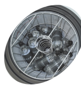
Indvendig ventilator og kurv